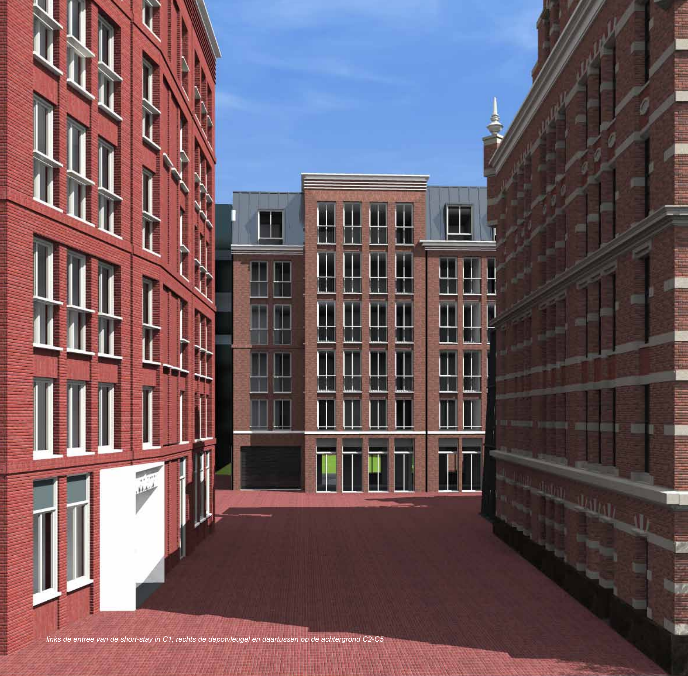
links de entree van de short-stay in C1, rechts de depotvleugel en daartussen op de achtergrond C2-C5