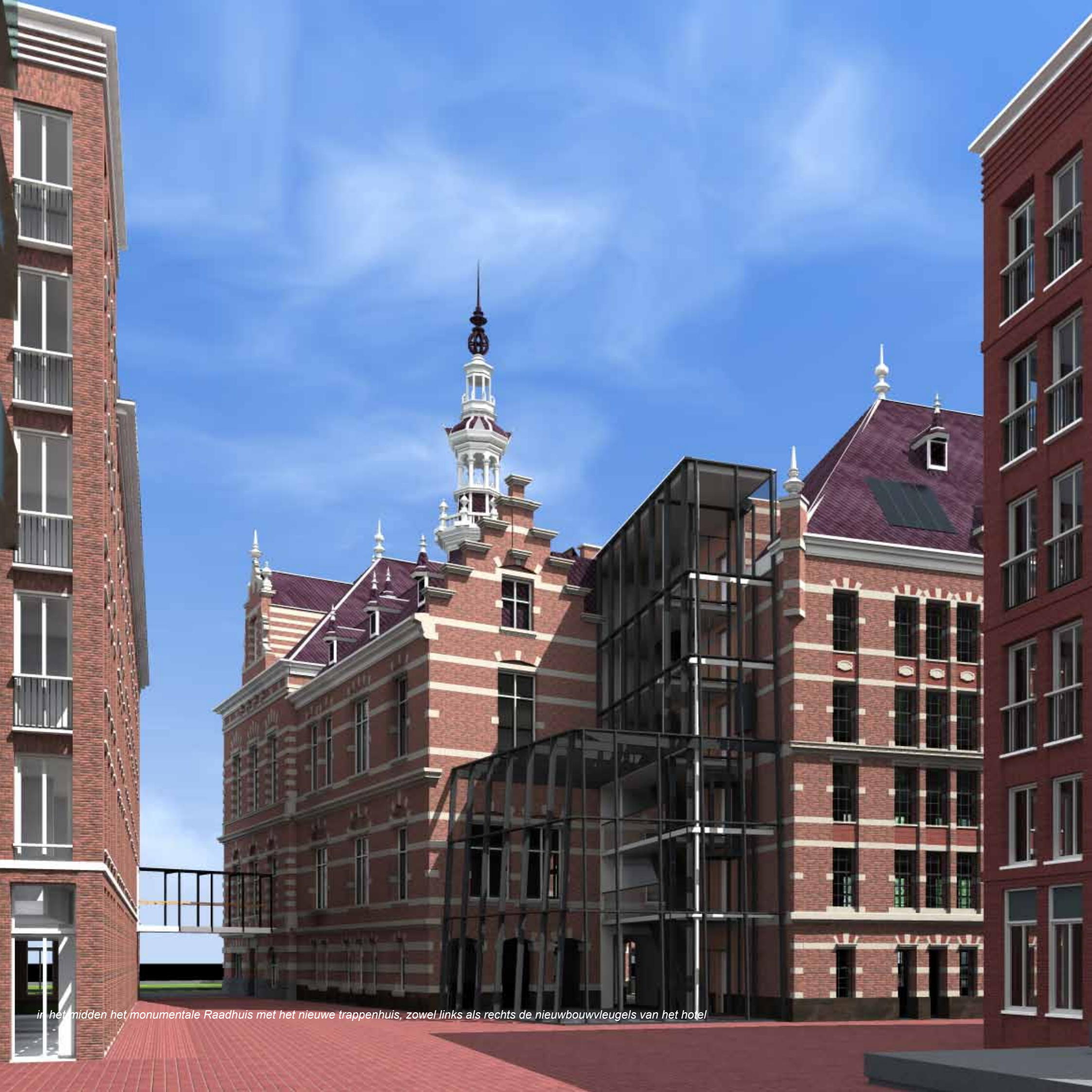
in het midden het monumentale Raadhuis met het nieuwe trappenhuis, zowel links als rechts de nieuwbouwvleugels van het hotel